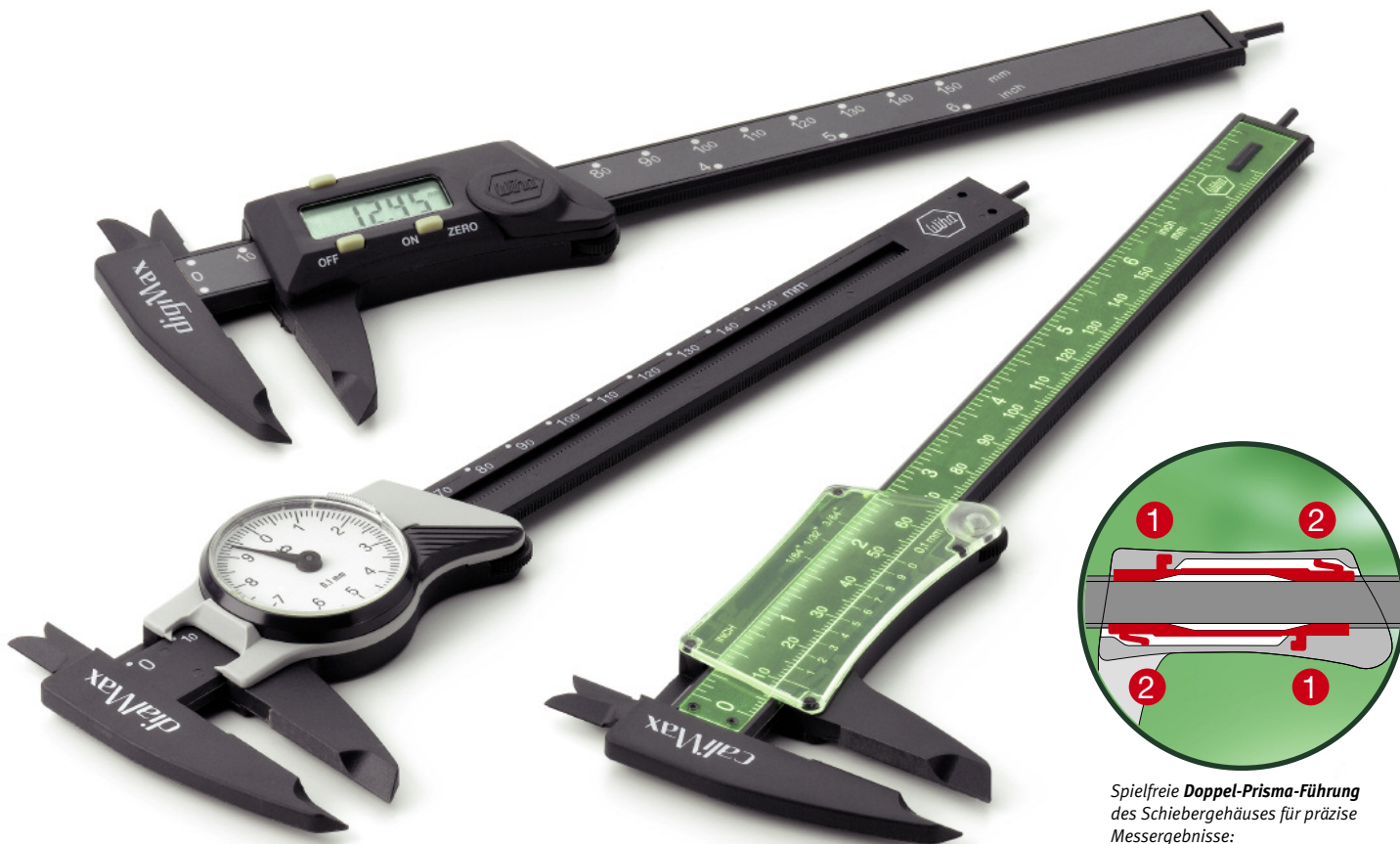
Spielfreie Doppel-Prisma-Führung des Schiebergehäuses für präzise Messergebnisse: 1. starre Fixierung 2. federnder Gegenhalter

Mit dem weltweit ersten nicht-metallischen Messschieber, gefertigt aus einem hochwertigen Fiberglas verstärkten Werkstoff in hoher Schweizer Präzision, wurde im Jahr 1965 Neuland betreten. Aufgrund der einmaligen Vorteile des High-Tech Werkstoffes haben sich die Produkte der "max-Serie" Einsatzfelder erschlossen, bei dem sie gegenüber der schwereren Metall-Ausführung deutliche Vorteile zeigen.