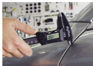
Die Messschnäbel der Fiberglas verstärkten Messschieber erlauben eine kratzfreie Messung selbst an hoch empfindlichen, glänzenden Oberflächen.

Messflächen durch angezogene Metallspäne und damit die Beeinträchtigung der Messgenauigkeit. Selbst zum Ausmessen von Magneten können die Wiha Messschieber benutzt werden. Der Einsatz in feuchten Arbeitsumgebungen ist für die Wiha Messschieber dank des nicht korrodierenden Werkstoffes kein Problem.