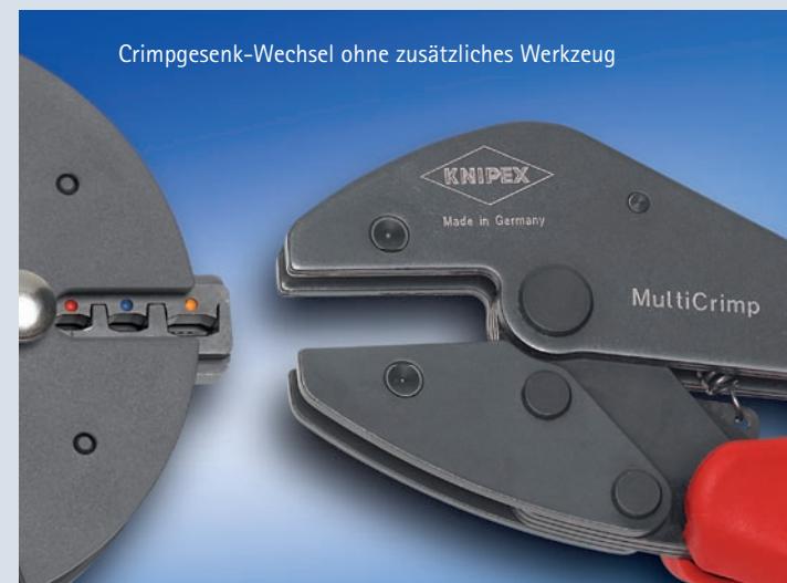
Crimpgesenk-Wechsel ohne zusätzliches Werkzeug

Für die gängigsten Crimpanwendungen benötigt der Elektriker im mobilen Service-Einsatz bisher mindestens 3 verschiedene Crimpzangen. Das neue MultiCrimp-System liefert jetzt die Lösung für den professionellen Crimpanwender: Set bestehend aus Zange zusammen mit Magazin und wahlweise 3 oder 5 Wechselseinsätzen für unterschiedliche Anwendungen vor Ort.