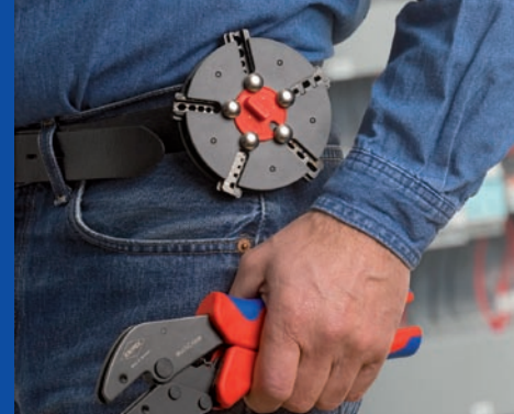
Rundmagazin mit Gürtelclip: Wechseleinsätze immer griffbereit