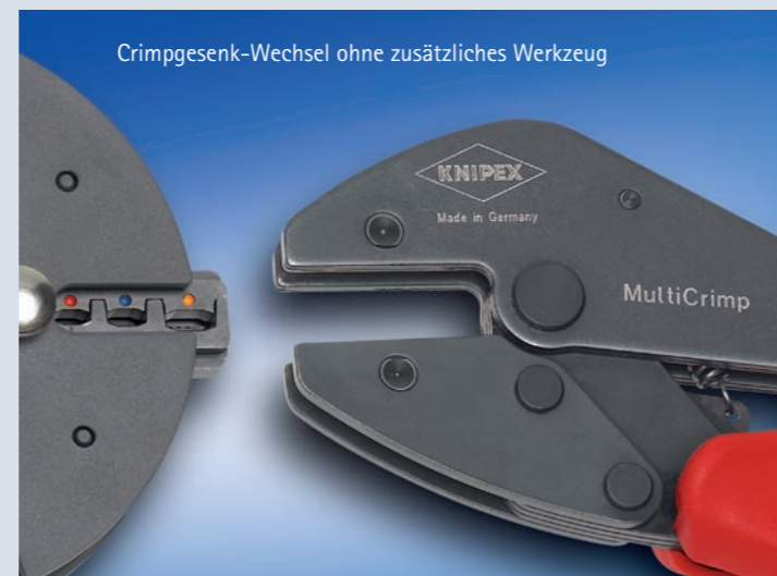
Crimpgesenk-Wechsel ohne zusätzliches Werkzeug

Für die gängigsten Crimpanwendungen benötigt der Elektriker im mobilen Service-Einsatz bisher mindestens 3 verschiedene Crimpzangen. Das neue MultiCrimp-System liefert jetzt die Lösung für den professionellen Crimpanwender: Set bestehend aus Zange zusammen mit Magazin und wahlweise 3 oder 5 Wechselseinsätzen für unterschiedliche Anwendungen vor Ort.