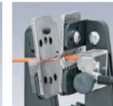
Formstrüßiges Abisolieren durch präzise Messerprofile