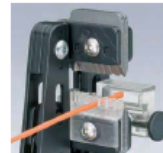
12 12 02 mit Kabelführung und Längenschnitt

Auch bei schwierigen Materialien wie Teflon® und Radax® funktioniert das ohne Probleme.