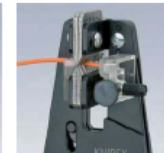
Saubere Einschnitte der Isolation auf dem gesamten Umfang