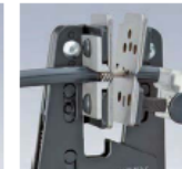
Automatisches Abziehen der Isolation