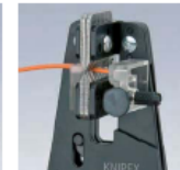
Saubere Entschneiden der Isolation auf dem gesamten Umfang