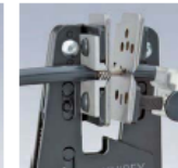
Automatisches Öffnen der Zange nach der Isolation