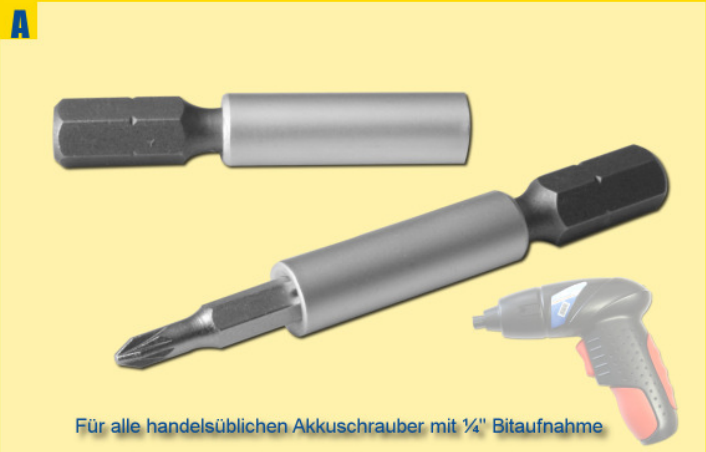
Für alle handelsüblichen Akkuschauber mit 1/4" Bitaufnahme

For individual assembly with 7 card locations for 4 mm of mini bits, the practical mounting plate for on the way with key ring.