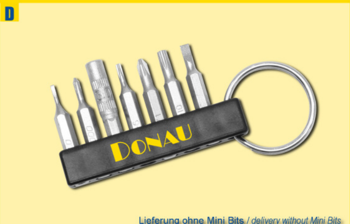
Lieferung ohne Mini Bits / delivery without Mini Bits