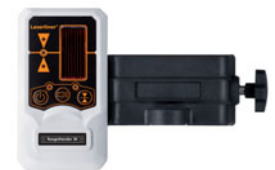
RangeXtender RX 30 inklusive Universalhalterung + Batterien

Verpackungsgröße (B x H x T) 190 x 310 x 60 mm