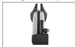
Stehende Aufbewahrung, platzsparend