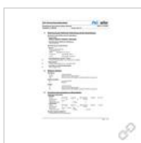
Sicherheitsdatenblatt Braun Shaver Cleaner (Aerosol)