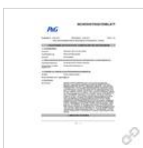
Sicherheitsdatenblatt Braun Shaver Cleaner