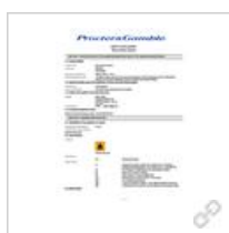
Sicherheitsdatenblatt Braun Shaver Cleaner