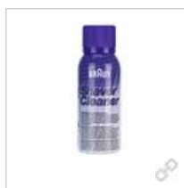
Reinigungsspray 100 ml