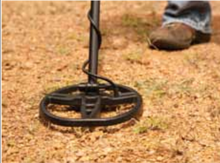
Neue DD-Sonde bietet bessere Ortungstiefe auf mineralisierten Böden.