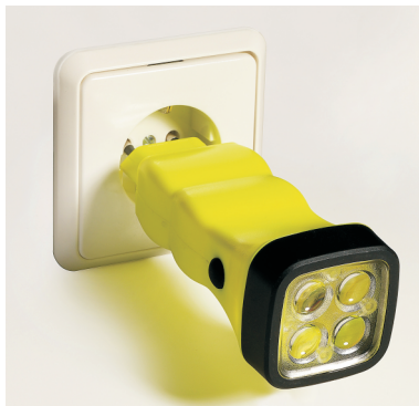
Bild 5: Die wiederladbare Leuchte Typ 4172... mit integrierten Netzladestecker