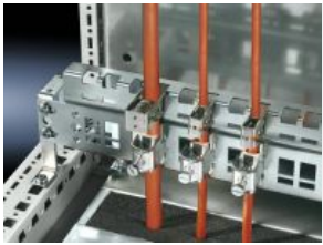
Schiene für EMV-Schirmbügel und Zugentlastung

Bitte beachten Sie auch folgende Alternativ-Produkte: