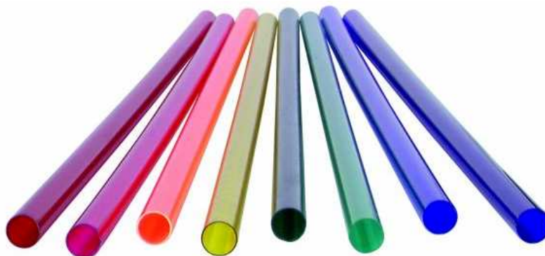
Maßangabe in mm

Wertet Ihre Neonröhre auf Zum Überziehen auf einfache weiße Neonröhren In unterschiedlichen aktuellen Farben rot, grün, gelb, türkis, pink, violett, orange und blau Neonröhren einmal anders