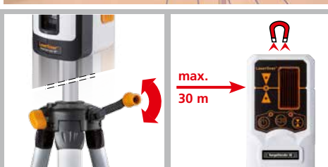
Schnelle stufenlose Verstellung