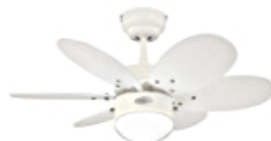
weiss oder Ahorn (beide Seiten möglich)