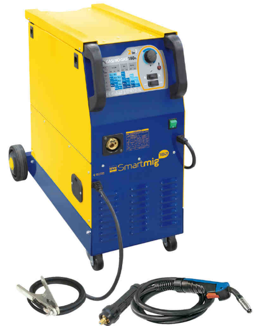
Gerät mit Zubehör – Art.-Nr. 033184 Brenner MIG 150A (3m) + Masseklemme (3m)

Dank dem SMART Chart wird die Einstellung der Schweißleistung (4 Stufen) und Drahtvorschubgeschwindigkeit wesentlich erleichtert. Intuitive Einstellungen nach Auswahl von Materialstärke, Typ und Durchmesser des verwendeten Drahtes.