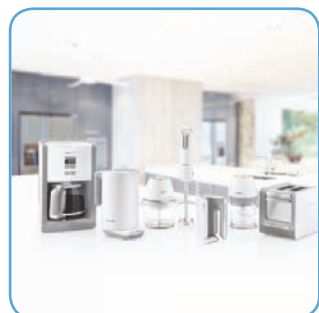
White Sense Serie