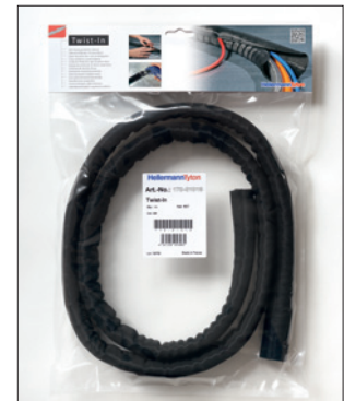
Twist-In Handelsverpackung für den gelegentlichen Bedarf.