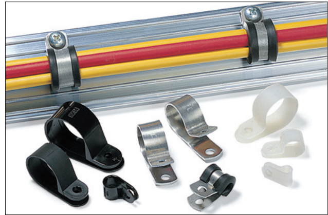
Die Befestigungsschellen sind in unterschiedlichen Materialien und Ausführungen erhältlich.