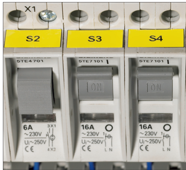
Helatag-Laser-Etiketten ermöglichen die einfache und schnelle Kennzeichnung von Schaltschränken.