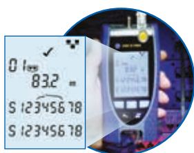
Verdrahtungstest inkl. Länge