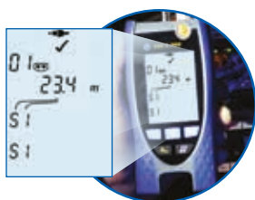
Überprüfung einer Koaxleitung