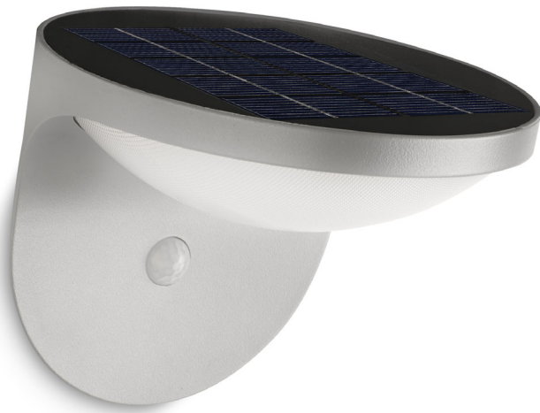
Philips myGarden Wandleuchte