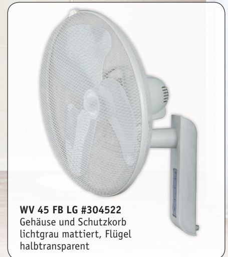
WV 45 FB LG #304522 Gehäuse und Schutzkorb lichtgrau mattiert, Flügel halbtransparent