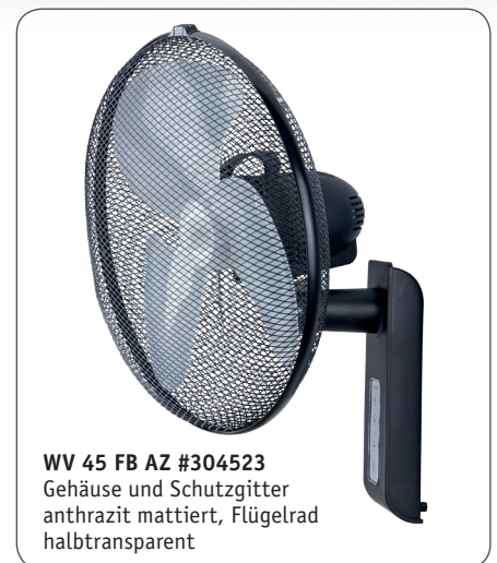
WV 45 FB AZ #304523 Gehäuse und Schutzgitter anthrazit mattiert, Flügelrad halbtransparent