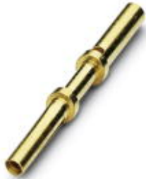
Crimpkontakt, gedreht, Kontaktdurchmesser: 0,6 mm, Crimpbereich: 0,34 mm 2 ...0,5 mm 2

Bitte beachten Sie, dass die hier angegebenen Daten dem Online-Katalog entnommen sind. Die vollständigen Informationen und Daten entnehmen Sie bitte der Anwenderdokumentation. Es gelten die Allgemeinen Nutzungsbedingungen für Internet-Downloads. ( http://download.phoenixcontact.de )