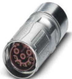
Kabelsteckverbinder, gerade, SPEEDCON-Verriegelung, M17, Polzahl: 8, Kontaktart: Buchse, Crimpanschluss, geschirmt: ja, Kabeldurchmesser: 5 mm...9 mm

Bitte beachten Sie, dass die hier angegebenen Daten dem Online-Katalog entnommen sind. Die vollständigen Informationen und Daten entnehmen Sie bitte der Anwenderdokumentation. Es gelten die Allgemeinen Nutzungsbedingungen für Internet-Downloads. ( http://download.phoenixcontact.de )