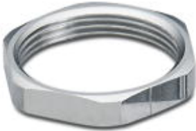
Kontermutter M18 x 0,75

Bitte beachten Sie, dass die hier angegebenen Daten dem Online-Katalog entnommen sind. Die vollständigen Informationen und Daten entnehmen Sie bitte der Anwenderdokumentation. Es gelten die Allgemeinen Nutzungsbedingungen für Internet-Downloads. ( http://download.phoenixcontact.de )