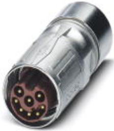
Kabelsteckverbinder, gerade, SPEEDCON-Verriegelung, M17, Polzahl: 8, Kontaktart: Stift, Crimpanschluss, geschirmt: ja, Kabeldurchmesser: 9 mm...11 mm

Bitte beachten Sie, dass die hier angegebenen Daten dem Online-Katalog entnommen sind. Die vollständigen Informationen und Daten entnehmen Sie bitte der Anwenderdokumentation. Es gelten die Allgemeinen Nutzungsbedingungen für Internet-Downloads. ( http://download.phoenixcontact.de )