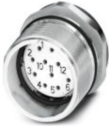
Gerätesteckverbinder Vorderwand, gerade, geschirmt: ja, SPEEDCON-Verriegelung, M23, Polzahl: 12, Kontaktart: Buchse, Crimpanschluss, Dichtung axial, Zentralbefestigung

Bitte beachten Sie, dass die hier angegebenen Daten dem Online-Katalog entnommen sind. Die vollständigen Informationen und Daten entnehmen Sie bitte der Anwenderdokumentation. Es gelten die Allgemeinen Nutzungsbedingungen für Internet-Downloads. ( http://download.phoenixcontact.de )