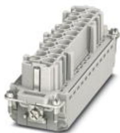
HEAVYCON Buchseneinsatz, Serie B24, 24 + polig, Push-in-Anschluss

Bitte beachten Sie, dass die hier angegebenen Daten dem Online-Katalog entnommen sind. Die vollständigen Informationen und Daten entnehmen Sie bitte der Anwenderdokumentation. Es gelten die Allgemeinen Nutzungsbedingungen für Internet-Downloads. ( http://phoenixcontact.de/download )