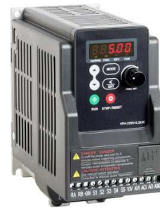
Frequenzumrichter FUS 020 ... 220/L5 FUS 075 ... 220/3L5 CE c UL US LISTED