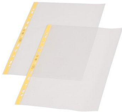
3017.319.IDP DIN A4