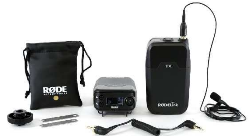
Das RØDELink Filmmaker Kit ist komplett – lediglich 4 Batterien (AA) benötigt es noch zum Arbeiten.

Fellwindschutz WS-LAV für Außenaufnahmen bis Windstärke 4