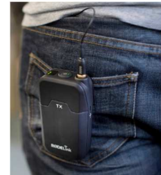
Der Sender wiegt inklusive Batterien nur ca. 190 g und lässt sich auch an einer Gesäßtasche befestigen.