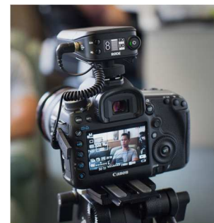
Der Empfänger wird auf den Blitzschuh gesteckt und über das beiliegende Spiral-Anschlusskabel mit der Kamera verbunden.