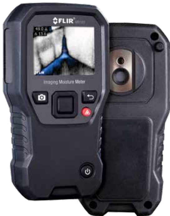
MR160 Feuchtemessgerät mit integrierter Wärmebildkamera