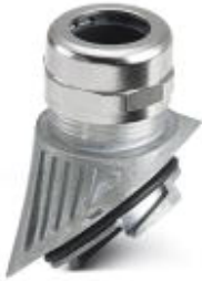
EVO-Metallkabelverschraubung mit Bajonettverschluss, Serie B, Größe M32, Leitungsdurchmesser 14-21mm

Bitte beachten Sie, dass die hier angegebenen Daten dem Online-Katalog entnommen sind. Die vollständigen Informationen und Daten entnehmen Sie bitte der Anwenderdokumentation. Es gelten die Allgemeinen Nutzungsbedingungen für Internet-Downloads. ( http://phoenixcontact.de/download )