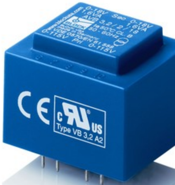
Abbildung zeigt AVB 3,2/2/18