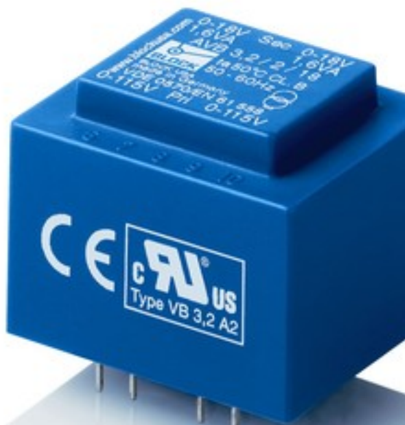
Abbildung zeigt AVB 3,2/2/18