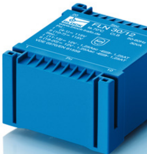
Abbildung zeigt FLN 30/12