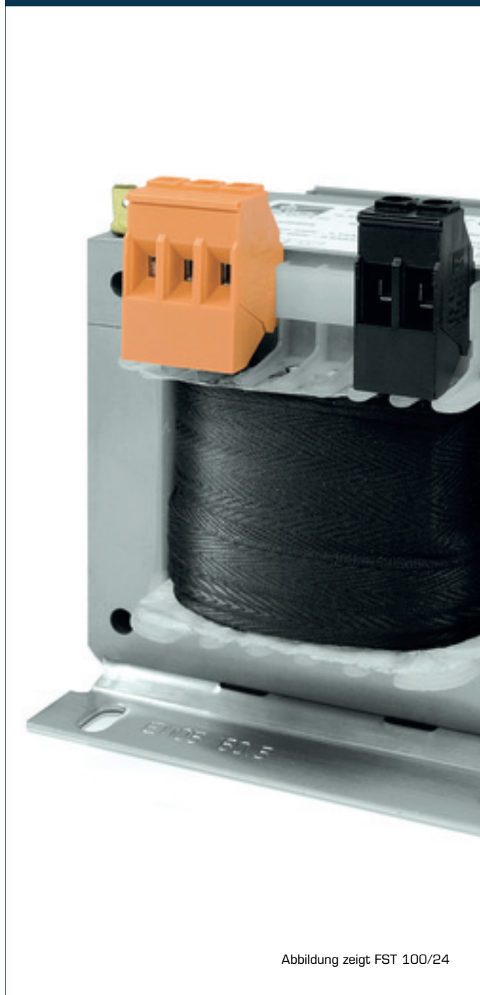
Abbildung zeigt FST 100/24