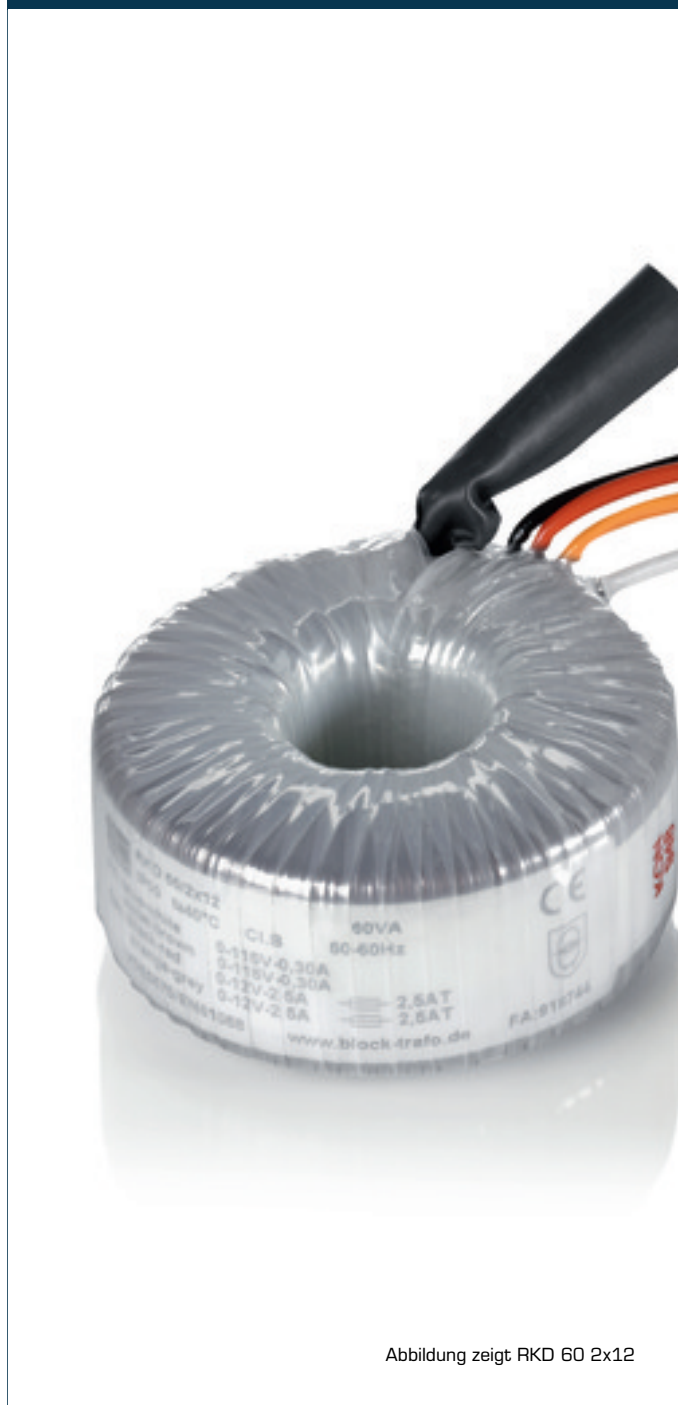
Abbildung zeigt RKD 60 2x12