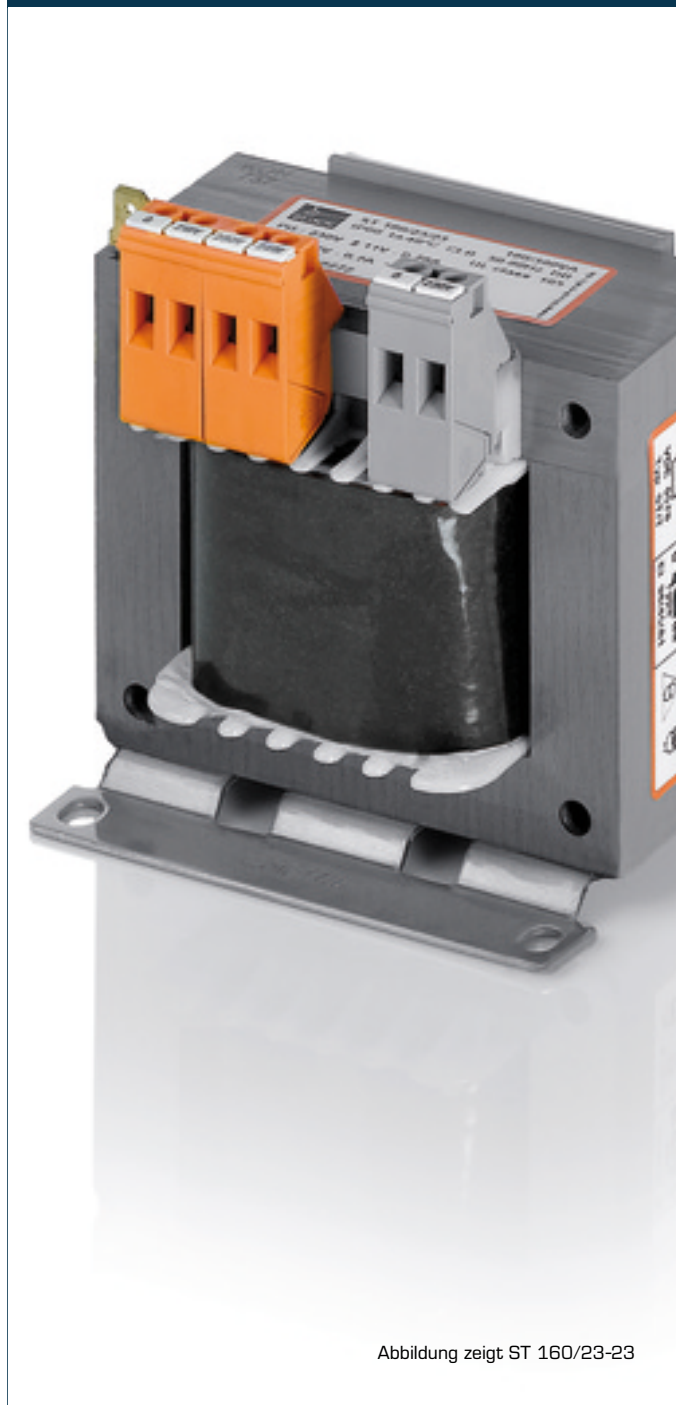
Abbildung zeigt ST 160/23-23