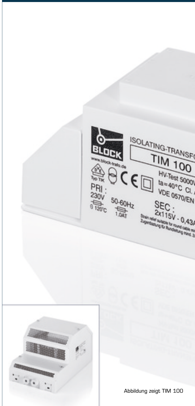
Abbildung zeigt TIM 100