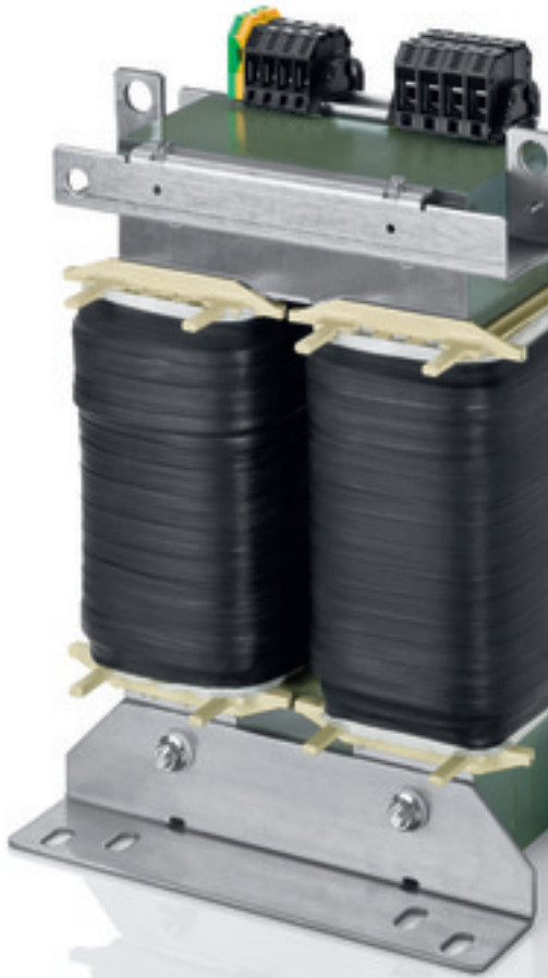
Abbildung zeigt TT1 20-4/23