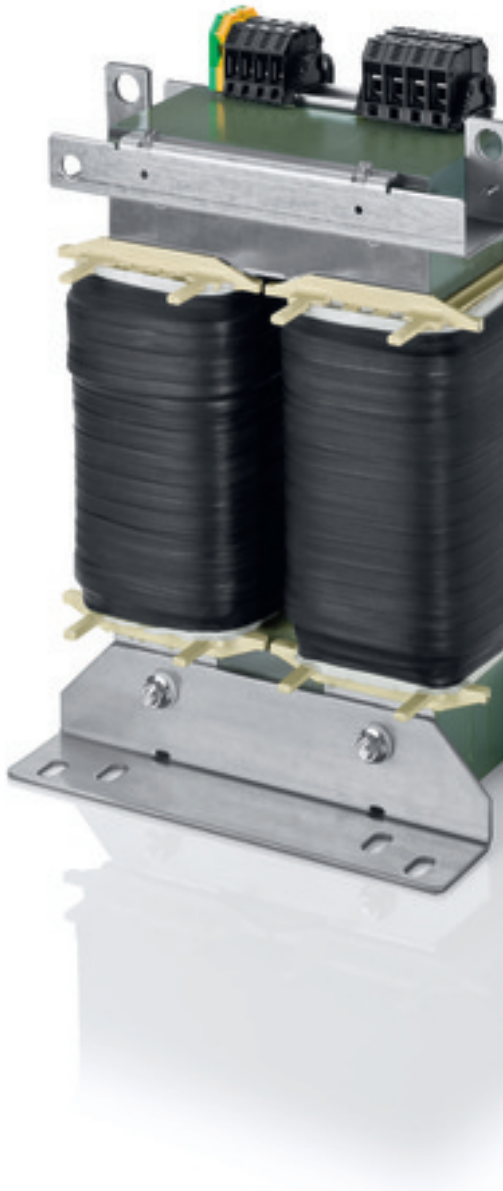
Abbildung zeigt TT1 20-4/23