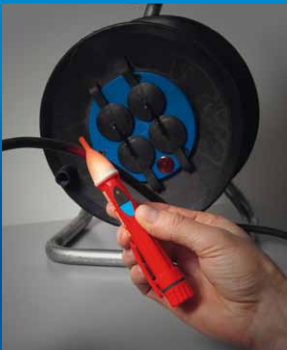
Auffinden von Kabelbrüchen an isolierten und unter Spannung stehenden Leitungen