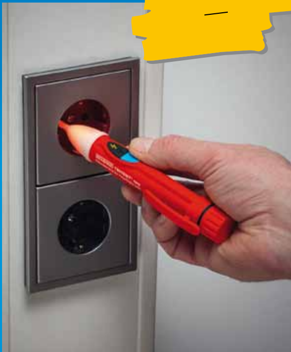
Phasenprüfung an Schutzkontaktsteckdosen und Abzweigdosen.