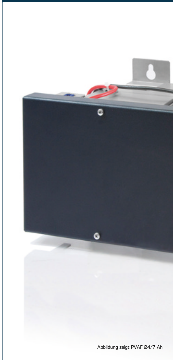
Abbildung zeigt PVAF 24/7 Ah