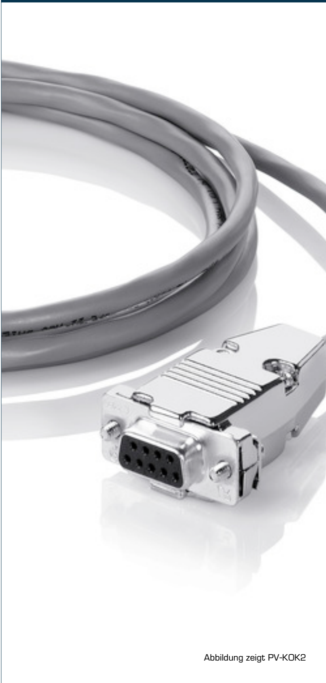
Abbildung zeigt PV-KOK2