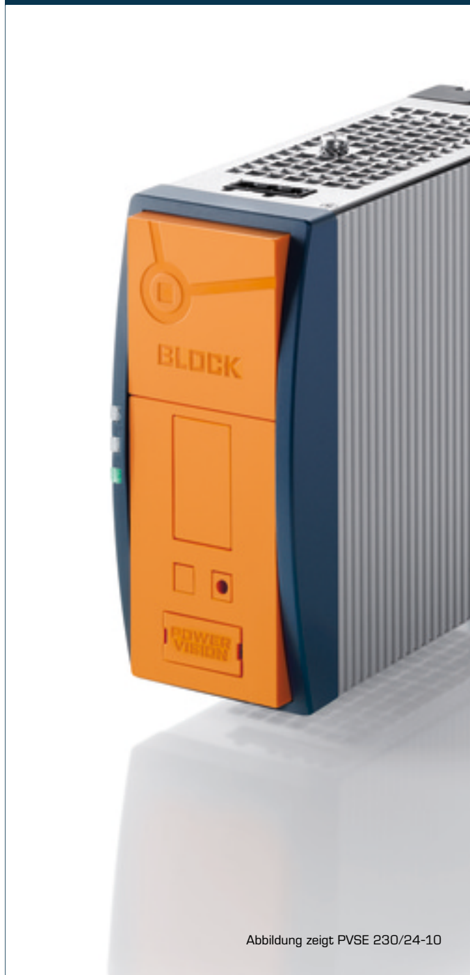
Abbildung zeigt PVSE 230/24-10