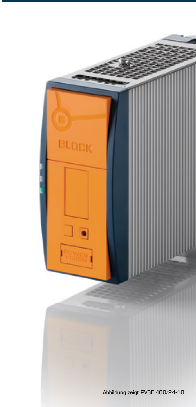
Abbildung zeigt PVSE 400/24-10