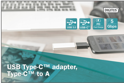
USB Type-C™ adapter, Type-C™ to A